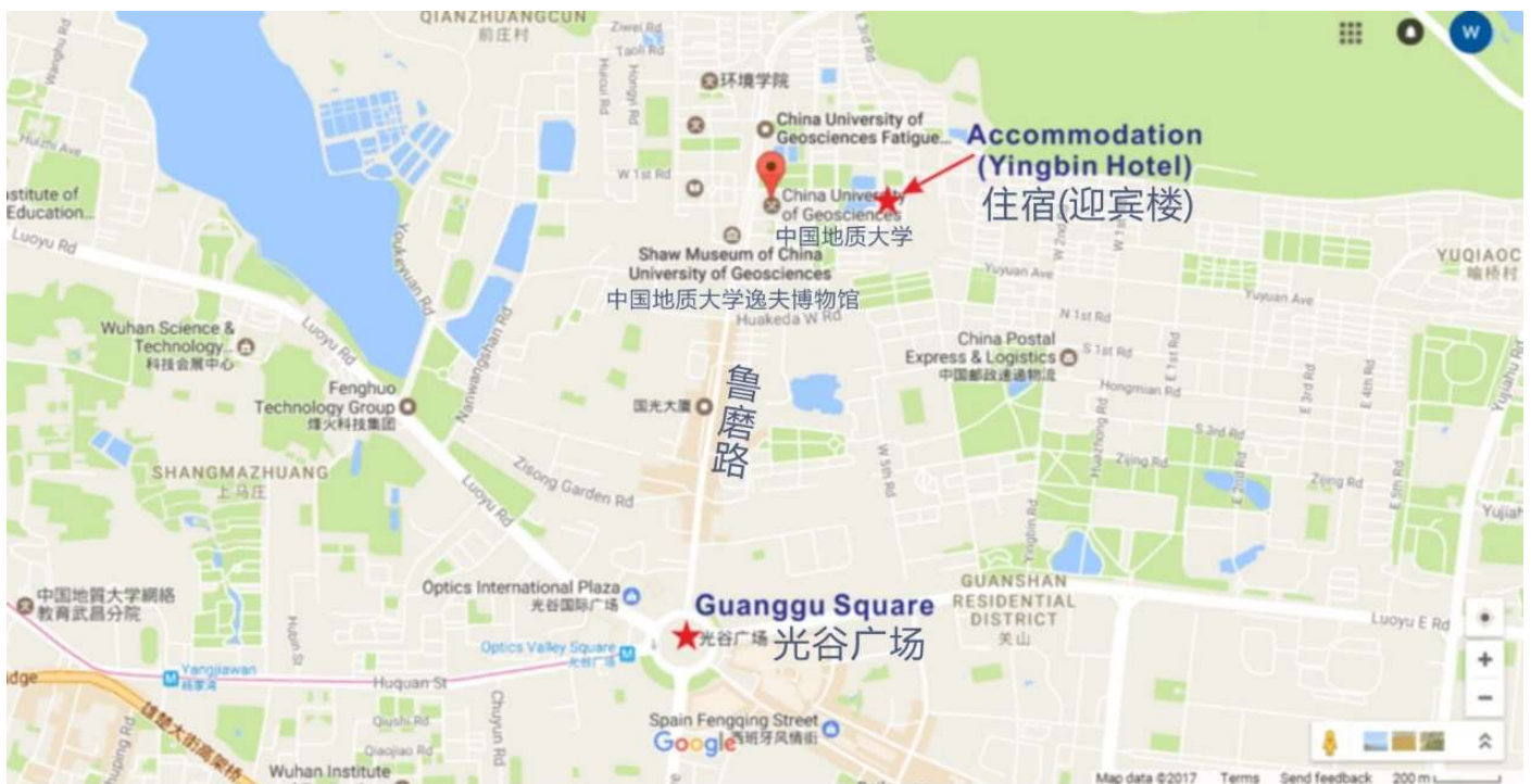
图 1：迎宾楼及光谷广场位置图

住宿： 坐落于中国地质大学（武汉）校园内的迎宾楼（图 1）可提供一定数量房间，如需预订校内住宿，请于 2017年7月1日 前联系 3dwc2017@cug.edu.cn 预留房间。